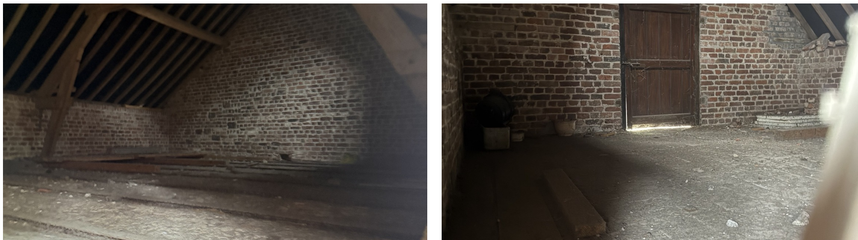
Vues interieures - volume sous charpente et plateau libre.

Le volume interieur presente un plateau simple, lisible et evolutif. Avant tout deploiement, les etapes techniques a prevoir sont le nettoyage, la securisation d acces, la verification structurelle, le traitement des poussieres, la ventilation/extraction et la creation d une alimentation electrique dediee.