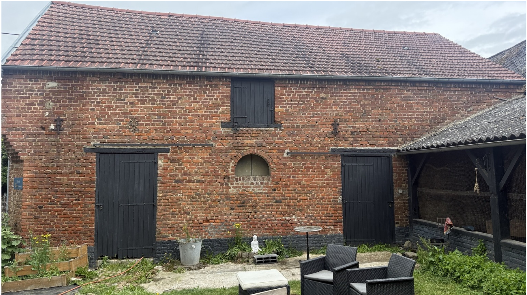
Plateau technique potentiel dans une ancienne ferme en briques - Sepmeries