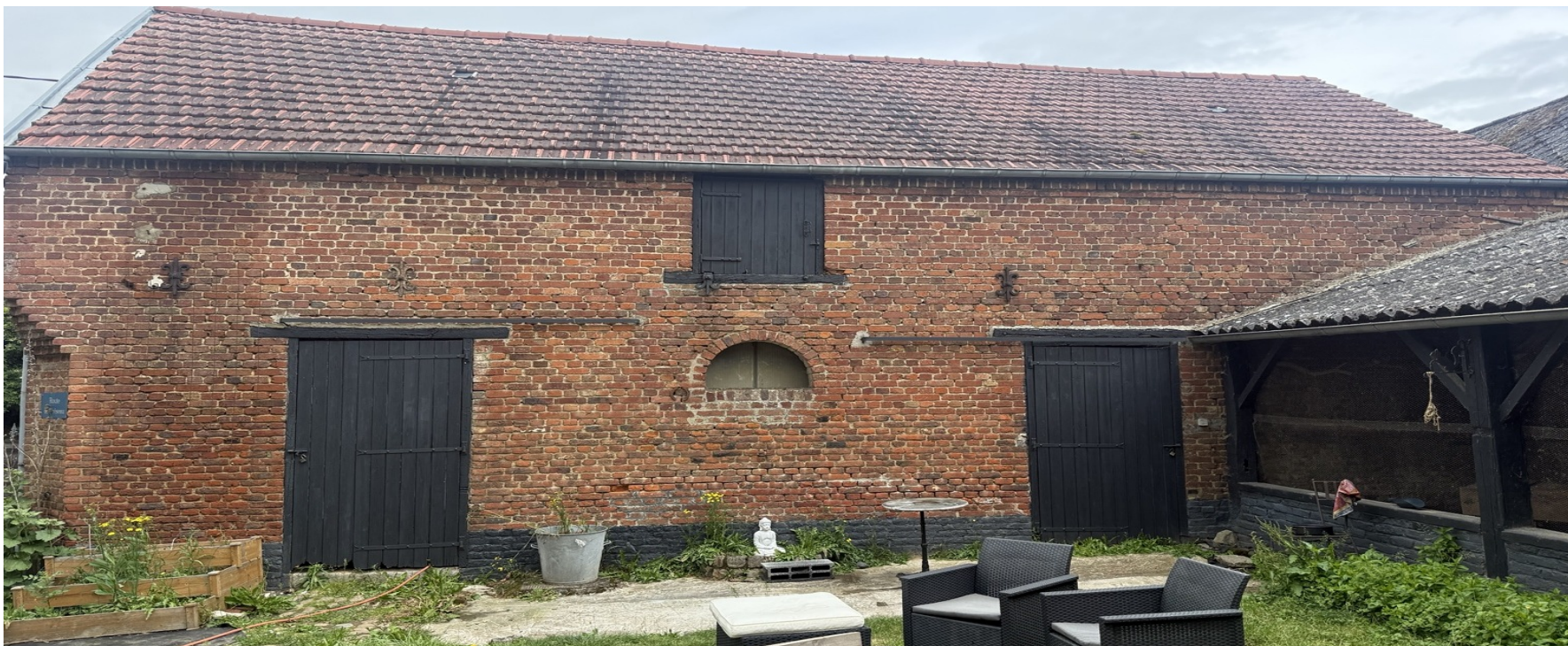
Facade principale de la dependance cible - acces, volume et separation potentielle des usages.

Dans la communication du projet, le terme 'grange' doit etre reserve a la description patrimoniale. Pour les partenaires, la bonne terminologie est 'plateau technique', 'espace d infrastructure' ou 'site pilote'.